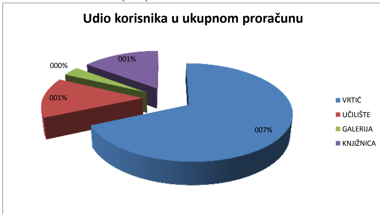
Grafikon 3. Udio korisnika u ukupnom proračunu